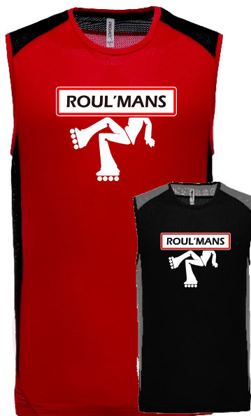
T-Shirt sans manche