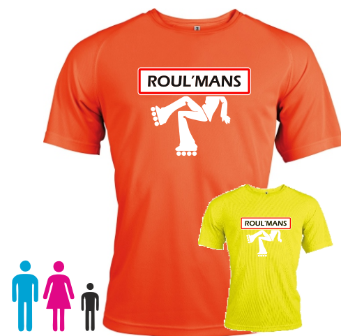
T-Shirt technique fluo