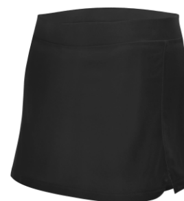
Jupe doublée short